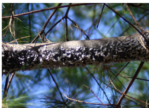
Figura 9 Ramură de pin strob cu atac de Eopineus strobus la Câmpulung Moldovenesc.

exemplar mascul a fost colectat de către primul autor al acestei lucrări în data 8.12.2016, de pe un arbore de P. menziesii din apropierea clădirii sediului INCDS, din localitatea Voluntari (44°30'7"N; 26°10'58"E). Tăind o ramură purtătoare de conuri, odată cu ramura respectivă a căzut pe sol și un exemplar viu de L. occidentalis . În mod similar, în data de 13 decembrie 2016 a fost recoltat un exemplar din această specie odată cu niște conuri de P. strobus , din plantajul de la Rupea, județul Brașov (46°01'N 25°14'E) (I. Smirnov, comunicare personală).