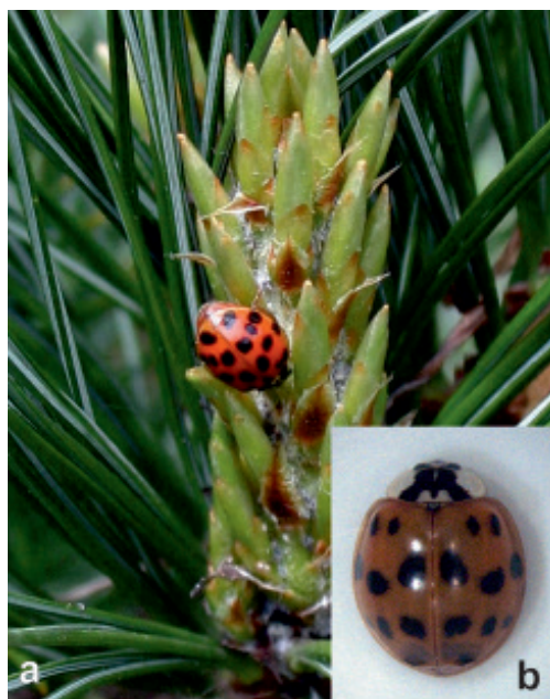
Figura 7 Adult de H. axyridis pe un puiet de Pinus cembra din plantajul de la Demacușa (a). Exemplar colectat la Câmpulung Moldovenesc (b) H. axyridis adult on a sapling of Swiss stone pine in the seed orchard in Demacușa (a). Specimen collected in Câmpulung Moldovenesc (b)

Un adult de Harmonia axyridis a fost observat în data de 14.05.2015 pe un puiet de Pinus cembra L. (fig. 7a) din plantajul de la Demacușa (Baza Experimentală Tomnatic, U.P. I Demacușa, u.a. 40B; 47°41'29"N; 25°29'47"E), unii dintre puietii respectivi fiind coloniizați de Pineus cembrae (Cholodkovsky 1888). Un alt exemplar (fig. 7b) a fost găsit în balconul locuinței primului autor, în Câmpulung Moldovenesc, în data de 30.10.2016. Ambele exemplare aparțin formei succinea . În data de 23.11.2016 au fost colectate 35 exemplare de H. axyridis , dintr-un balcon al Hotelului Sara de la Țicleni, județul Gorj (44°53'33"N; 23°26'32"E), situat la marginea unei păduri de cvercinee. Dintre exemplarele colectate, 33 aparțin formei succinea și două aparțin formei spectabilis . Împreună cu aceste insecte, în același loc s-au găsit numeroase exemplare de ploșnițe, dintre care