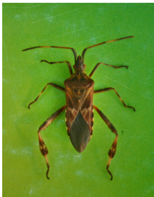
Figura 8 Exemplarul de Leptoglossus occidentalis colectat la Câmpulung Moldovenesc. Leptoglossus occidentalis specimen collected in Câmpulung Moldovenesc.

Un adult de Harmonia axyridis a fost observat în data de 14.05.2015 pe un puiet de Pinus cembra L. (fig. 7a) din plantajul de la Demacușa (Baza Experimentală Tomnatic, U.P. I Demacușa, u.a. 40B; 47°41'29"N; 25°29'47"E), unii dintre puietii respectivi fiind coloniizați de Pineus cembrae (Cholodkovsky 1888). Un alt exemplar (fig. 7b) a fost găsit în balconul locuinței primului autor, în Câmpulung Moldovenesc, în data de 30.10.2016. Ambele exemplare aparțin formei succinea . În data de 23.11.2016 au fost colectate 35 exemplare de H. axyridis , dintr-un balcon al Hotelului Sara de la Țicleni, județul Gorj (44°53'33"N; 23°26'32"E), situat la marginea unei păduri de cvercinee. Dintre exemplarele colectate, 33 aparțin formei succinea și două aparțin formei spectabilis . Împreună cu aceste insecte, în același loc s-au găsit numeroase exemplare de ploșnițe, dintre care