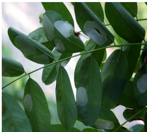
Figura 3 Atac de Phyllonorycter robiniella la arborii de salcâm de la Hănțești. Phyllonorycter robiniella mines on leaves of the black locust trees in Hănțești.