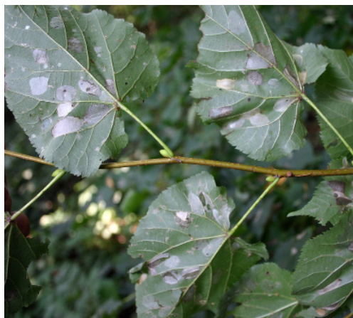
Figura 4 Atac de P. issikii la arborii de Tilia cordata de la Hănțești. P. issikii mines on leaves of the small-leaved lime trees in Hănțești.

inspectați), dar numai aproximativ 5% dintre frunze, în special cele de la baza coroanei, prezentau mine. Majoritatea aveau doar câte o singură mină, dar s-au găsit și frunze cu 3-4 mine. Tot în luna august 2016, într-un arboret de molid de la Demacușa (Baza Experimentală Tomnatic, U.P. I Demacușa, u.a. 105 C, 47°42'20"N; 25°28'1"E) pe doi puieti de tei pucios s-au găsit câteva frunze cu câte o mină făcută de această specie.