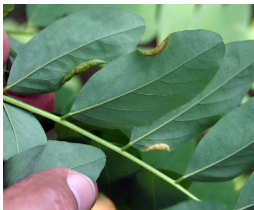
Figura 6 Atac de Obolodiplosis robiniae la arborii de salcâm de la Hănțești. Obolodiplosis robiniae galls on leaves of the black locust trees in Hănțești.