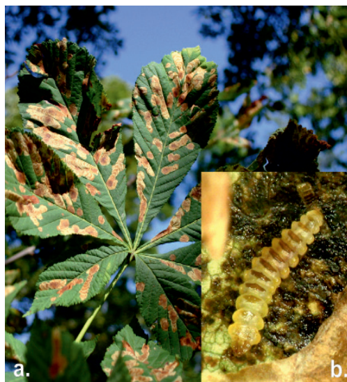
Figura 1 Frunze de castan porcesc cu atac de C. ohridella în parcul Mihai Eminescu din Câmpulung Moldovenesc (a); Larvă de C. ohridella (b).

Horse chestnut leaves attacked by C. ohridella in the Mihai Eminescu Park, in Campulung Moldovenesc (a); C. ohridella larva in an opened blotch leaf mine (b).