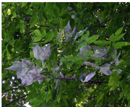
Figura 5 Cuiburi făcute de larvele de Hyphantria cunea pe ramuri de arțar american. Nests of Hyphantria cunea larvae on branches of ashleaf maple.

Atac de Obolodiplosis robiniae (fig. 6) s-a constatat pe frunzele de salcâm din parcul dendrologic de la Hănțești, în august 2010, când a fost observat și atacul de microlepidoptere miniere specifice salcâmului.