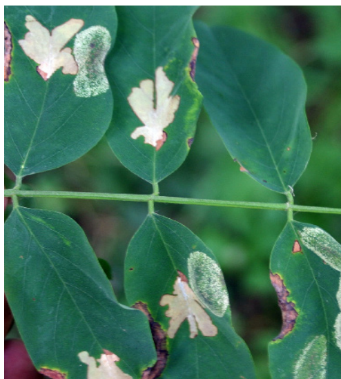
Figura 2 Atac de Parectopa robiniella la arborii de salcâm de la Hănțești.

Parectopa robiniella (fig. 2) a fost observată în 19.08.2007 la Cuștelnic, lângă Târnaveni, județul Mureș (46°20'44"N; 24°19'37"E), afectând cca. 50% din frunzele tufelor de salcâm și în august 2010 la Hănțești, județul Suceava (47°45'17"N; 26°22'13"E), atacul fiind în acest loc de intensitate slabă.